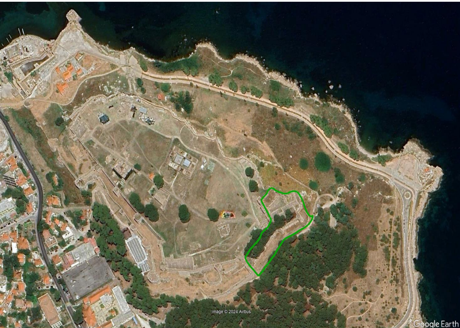
Περιοχή Πύργου Βασιλίσσας και τάφρου Καπάντη - 5.876τ.μ