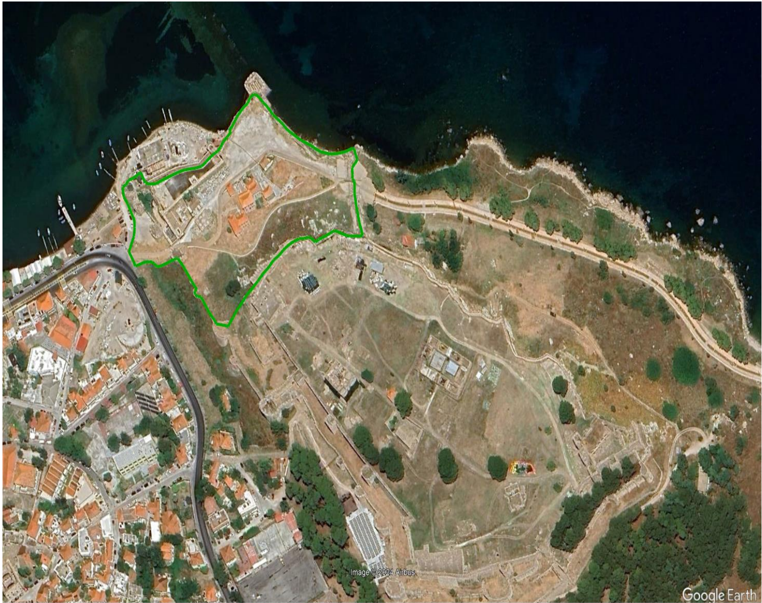
Περιοχή Κάτω Κάστρου - 19.014τ.μ