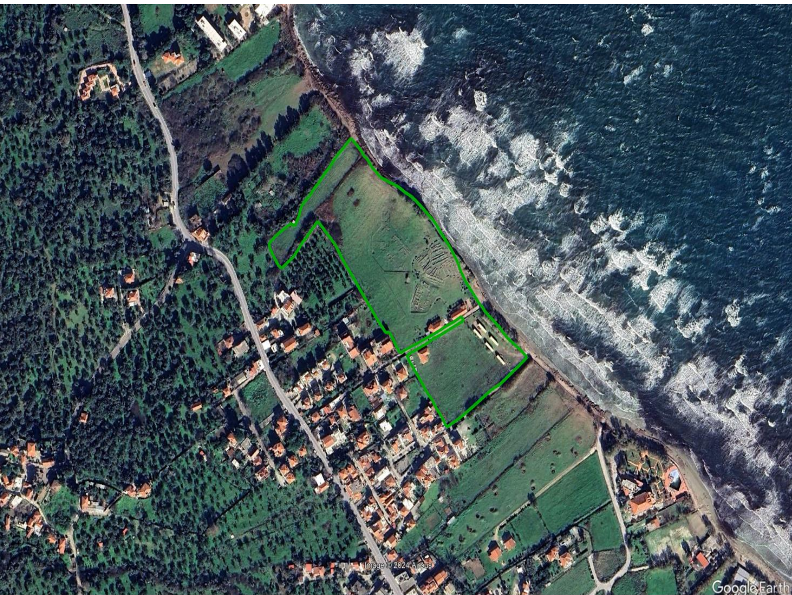
Περιοχή Προϊστορικού Οικισμού Θερμής - 31.312,50 τ.μ